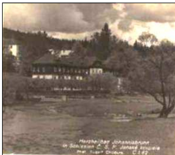
•d vznikem tábora

Razumovští byli původně potomky ukrajinských kozáků a jejich předkové, v diplomatických službách carského dvora, z Ruska odešli již v polovině 18. století.