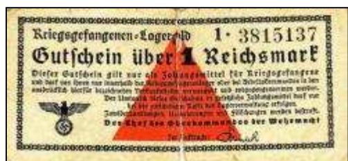
Ukázka táborové peněžní poukázky

Stalagů a Oflagů byly součástí systému německých zajateckých táborů také „Frontstalagy“ ( Frontstammlager für Kriegsgefangene ) – zajatecké tábory zřizované přímo v týlu fronty a „Dulagy“ ( Durchgangslager für Kriegsgefangene ) – průchozí, filtrační tábory sloužící k vyslýchání, rozřídování a dalšímu transportu zajatců. K internaci zajatých námořníků pak sloužily zvláštní tábory označované jako „Marlag“ ( Marinekriegsgefangenenlager für Marineangehörige ), pro zajaté letce měly Stalagy a Oflagy přídomek -“Luft“. Do systému patřily také zajatecké tábory, sloužící jako nemocnice, určené především pro raněné zajatce. Ty byly označovány „Kgf-Laz“ ( Lazarett für Kriegsgefangene ) – nemocnice pro vojenské zajatce nebo „Res-Laz“ ( Reserve-Lazarett ) – záložní nemocnice. Označení jednotlivých zajateckých táborů mělo také určený systém. Území Třetí říše bylo rozděleno na vojenské okruhy ( Wehrkreis ). Těch bylo v průběhu druhé světové války postupně 21 a byly označeny římskými číslicemi I – XXI. Jim podléhala také okruhová velitelství zajateckých táborů ( Wehrmachtsauskunftsstelle für Kriegerverluste und Kriegsgefangene ). Jako příklad můžeme uvést: Oflag VII A Murnau , což znamenalo: zajatecký tábor pro důstojníky (Oflag), zřízený jako první (A) v sedmém (VII) vojenském okruhu – Bavorsko, v městečku Murnau. Některé z táborů měly další doplňková označení. V případě „H“ šlo o hlavní tábor ( Hauptlager ), označení „N“ ( Nebenlager ) či „Z“ ( Zweiglager ) znamenalo pobočky.