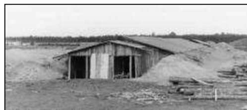
Táborový barák Stalagu v severním Německu

Stalagů a Oflagů byly součástí systému německých zajateckých táborů také „Frontstalagy“ ( Frontstammlager für Kriegsgefangene ) – zajatecké tábory zřizované přímo v týlu fronty a „Dulagy“ ( Durchgangslager für Kriegsgefangene ) – průchozí, filtrační tábory sloužící k vyslýchání, rozřídování a dalšímu transportu zajatců. K internaci zajatých námořníků pak sloužily zvláštní tábory označované jako „Marlag“ ( Marinekriegsgefangenenlager für Marineangehörige ), pro zajaté letce měly Stalagy a Oflagy přídomek -“Luft“. Do systému patřily také zajatecké tábory, sloužící jako nemocnice, určené především pro raněné zajatce. Ty byly označovány „Kgf-Laz“ ( Lazarett für Kriegsgefangene ) – nemocnice pro vojenské zajatce nebo „Res-Laz“ ( Reserve-Lazarett ) – záložní nemocnice. Označení jednotlivých zajateckých táborů mělo také určený systém. Území Třetí říše bylo rozděleno na vojenské okruhy ( Wehrkreis ). Těch bylo v průběhu druhé světové války postupně 21 a byly označeny římskými číslicemi I – XXI. Jim podléhala také okruhová velitelství zajateckých táborů ( Wehrmachtsauskunftsstelle für Kriegerverluste und Kriegsgefangene ). Jako příklad můžeme uvést: Oflag VII A Murnau , což znamenalo: zajatecký tábor pro důstojníky (Oflag), zřízený jako první (A) v sedmém (VII) vojenském okruhu – Bavorsko, v městečku Murnau. Některé z táborů měly další doplňková označení. V případě „H“ šlo o hlavní tábor ( Hauptlager ), označení „N“ ( Nebenlager ) či „Z“ ( Zweiglager ) znamenalo pobočky.