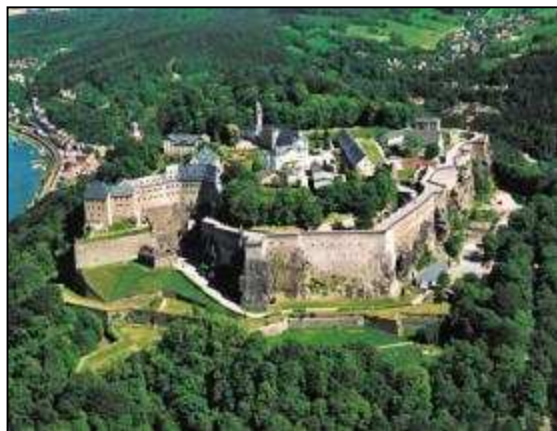
Saská pevnost Königstein

V meziválečném období byl velitelem francouzských vojsk v Africe. Za boje proti povstalcům v Maroku mu byl udělen řád Čestné legie a před druhou světovou válkou se stal vojenským velitelem v Metz. Po napadení Francie hitlerovským Německem byl velitelem 7. francouzské armády a v bojích v Nizozemsku se mu na počátku května 1940, u Bredy, podařilo zastavit útok Německých vojsk. Poté, co se po přeskupení vojsk snažil zastavit postup Wehrmachtu v Ardenách, byl dne 19. května