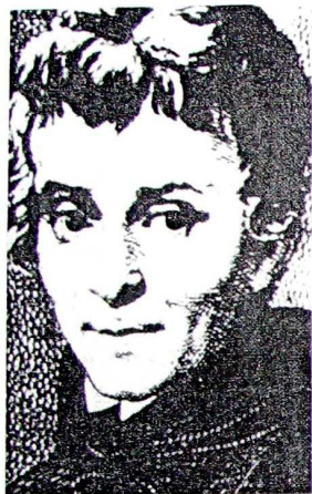
HALAŠKŮV PORTRÉT. Dřevoryt podobizny významného českého matematika, astronoma a přírodovědce Františka Ignáce Kassiana Halašky.

Poté byl přeložen na Tereziánskou akademii do Vídně, kde se specializoval na astronomii a vykonal zkloušky z matematiky a fyziky a byl jmenován profesorem. Vedle toho ještě obhájil doktorát filozofie. Učil nejprve na piaris-