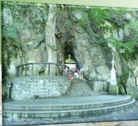
Budišov nad Budišovkou

Sebou něco na žízeň, pohodlnou obuv a dobrou náladu.