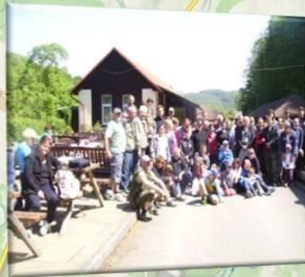
Akce na vlastní nebezpečí