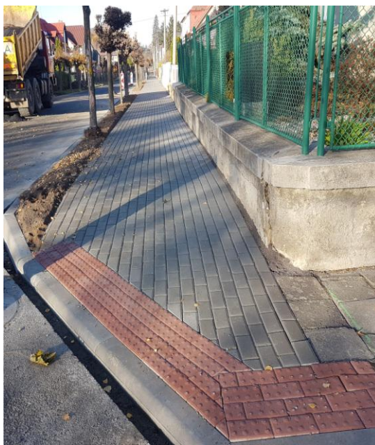
... a po rekonstrukci...